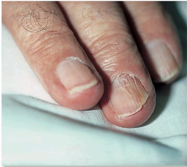
Abb. 6: Beginnende Nagelatrophie bei Syringomyelie