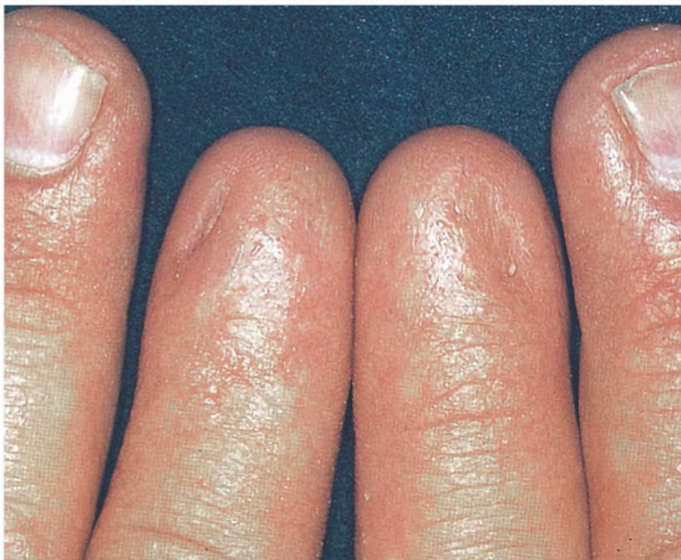
Abb. 2: Kongenitale Onychodysplasie der Zeigefinger. Beide Zeigefingernägel fehlen, und die Nagelbetten sind mit einem Ersatzgewebe überwachsen. Auch der Mittelfingernagel der rechten Hand ist deformiert.

Vorwiegend bei männlichen Personen ab etwa dem 10. Lebensjahr auftretende Polydysplasie mit kennzeichnender schwerer Dystrophie