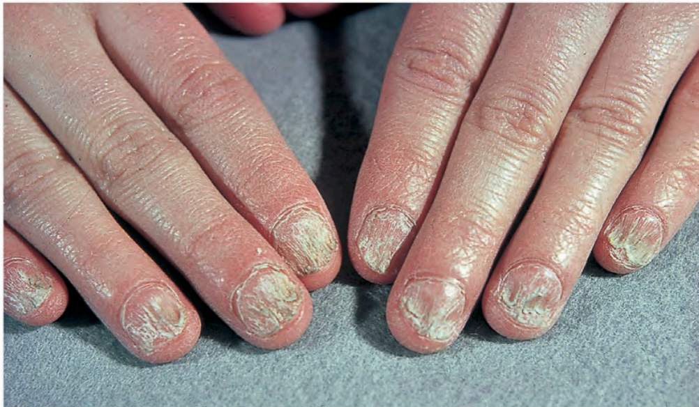
Abb. 3: Angeborene Nageldysplasie in Kombination mit Atrichie (kongenitales ektodermales Dysplasiesyndrom)

Erworbene Atrophien, d.h. stark verdünnte und verlangsamt wachsende, in der Regel dann auch brüchige Nägel, finden sich bei peripheren Durchblutungsstörungen, z.B. bei Raynaud-Syndrom und progressiver Sklerodermie sowie diabetischen Zirkulationsstörungen und bei neurologisch bedingten Störungen der Trophik (Abb. 6). Mit fortschreitender Minderdurchblutung und insbesondere bei arteriellem Verschluss werden die Nägel – nicht selten isoliert an einzelnen Fingern – abgestoßen, und die Nagelbetten vernarben (Abb. 7). Das Nagelhäutchen kann als Pterygium (vgl. Abb.