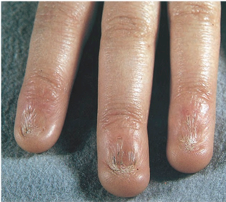
Abb. 4: Angeborene Anonychie mit Überwachsung der Nagelbetten durch die Nagelhäutchen (Pterygi- umbildung)