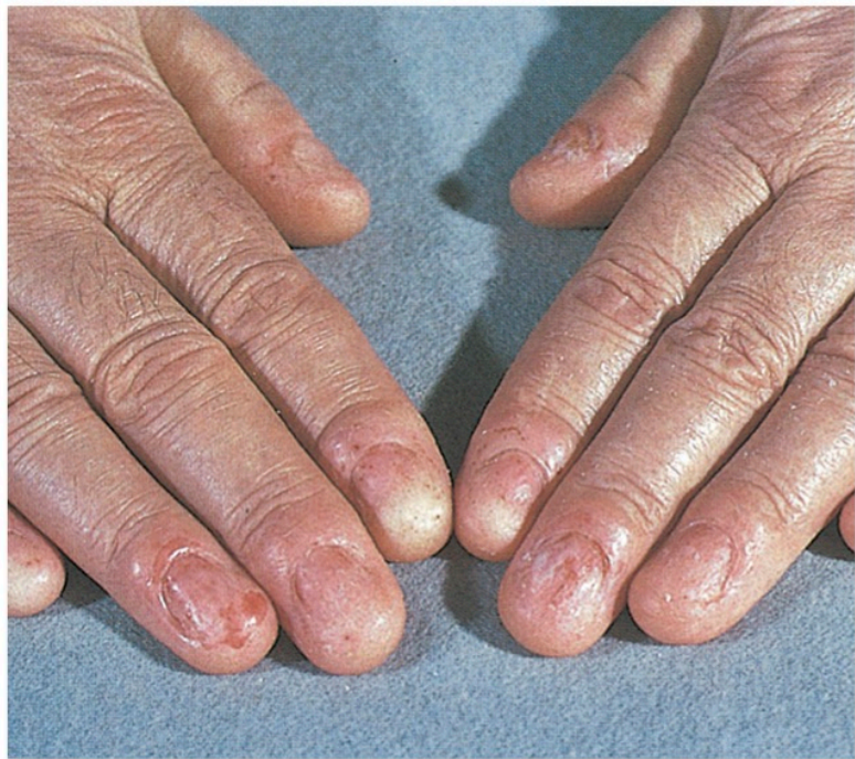
Abb. 7: Onychoatrophia totalis (hier vermutlich Folge eines Lichen ruber)