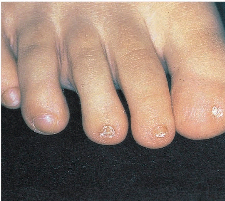
Abb. 5: Mikroonychie bei einem Fehlbildungssyndrom mit Skelettmissbildungen (Zimmermann-Laband- Syndrom)